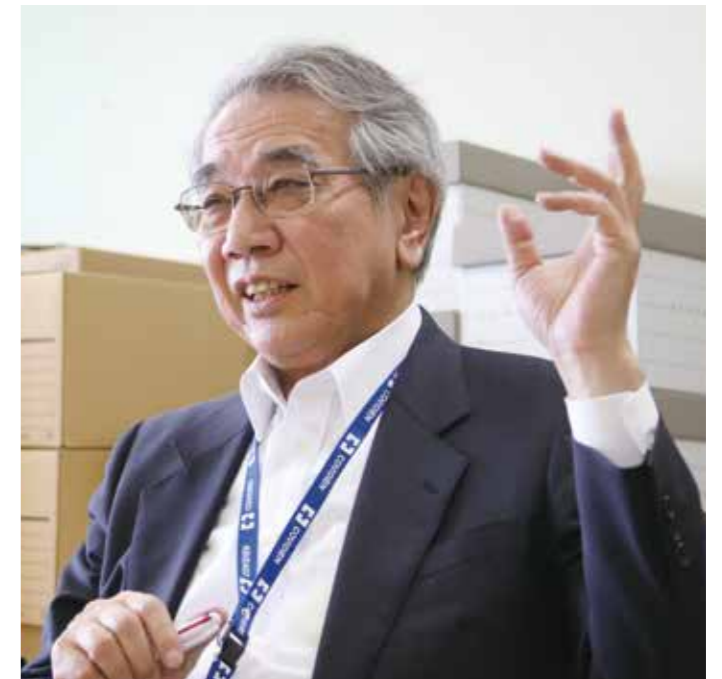
救命救急センター顧問、病院長補佐

間もなく数年のうちには、病院の増改築も控えています。増改築を機に、救命救急センターのハード面を整えるのはもちろんのこと、同じ法人グループの座間総合病院(神奈川県座間市)と連携しながら、病院長とともに神奈川県県央2次医療圏唯一の救命救急センターとしての体制強化を進めていきたいと考えています。今後とも一層のご協力をご支援をたまわりますよう、心よりお願い申し上げます。